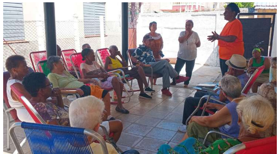
Tras la inauguración de la Casa de Abuelos de Mariel el pasado enero, se sumó a este espacio la Cátedra del Adulto Mayor

La cita también fue propicia para la presentación de publicaciones seriadas sobre el medio ambiente, que forman parte del registro de información de la Biblioteca Municipal.