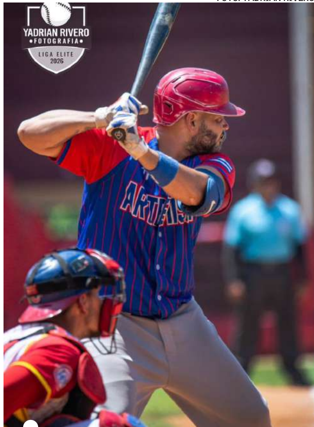
AUNQUE CON NÚMEROS destacados, el rendimiento de Dayán descendió en las postrimerías de la etapa clasificatoria

Encima, Israel Sánchez (aunque los números hablen de una campaña decorosa) no logró apagar los múltiples fuegos para los que fue llamado; por el contra-