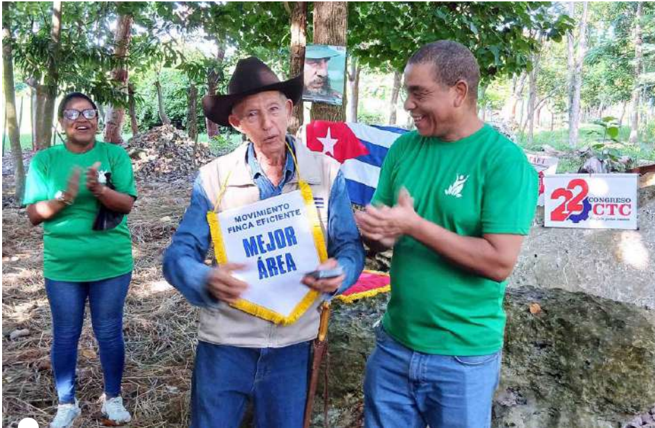
EL SNTAFT reconoció al Bosque Martiano del Ariguanabo como Mejor Área del Movimiento Emulativo Finca Eficiente