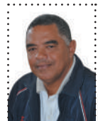
IMAGEN GENERADA CON IA