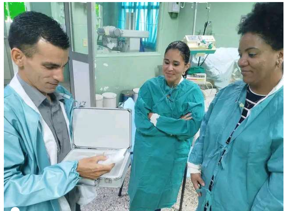
ESTE EQUIPO permite fortalecer la asistencia diaria, la docencia y la capacitación de los profesionales