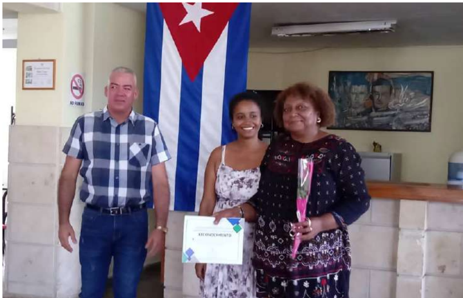
LA DELEGACIÓN provincial del Citma reconoció a entidades y organismos con un trabajo sostenido de preservación ambiental

TEXTO Y FOTOS ADIANEZ FERNÁNDEZ IZQUIERDO