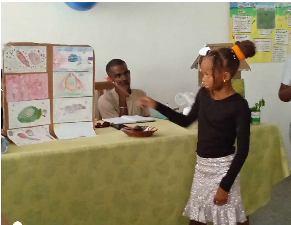
LOS NIÑOS Y NIÑAS fueron protagonistas de la jornada

TEXTO Y FOTOS ADIANEZ FERNÁNDEZ IZQUIERDO