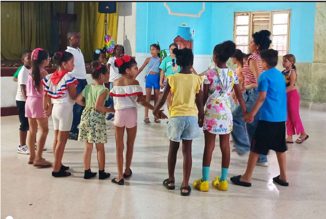
LOS NIÑOS disfrutaron de varios juegos de participación

TEXTO Y FOTOS YUSMARY ROMERO CRUZ yusmaryromerocruz@gmail.com