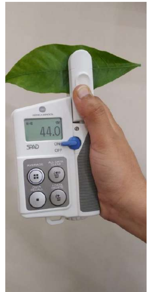
EL SPAD-502 mide la clorofila de la planta y posibilita determinar su nivel nutricional, desde que está en el semillero hasta la cosecha