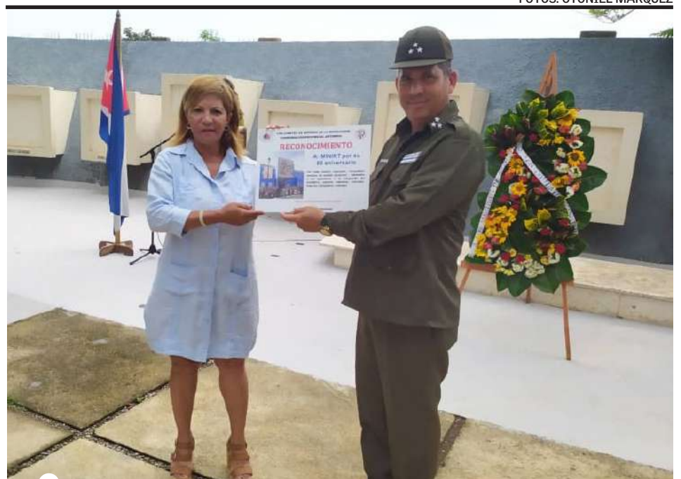
LOS COMITÉS de Defensa de la Revolución reconocieron a los combatientes del Ministerio del Interior, por ser garantes de la tranquilidad ciudadana