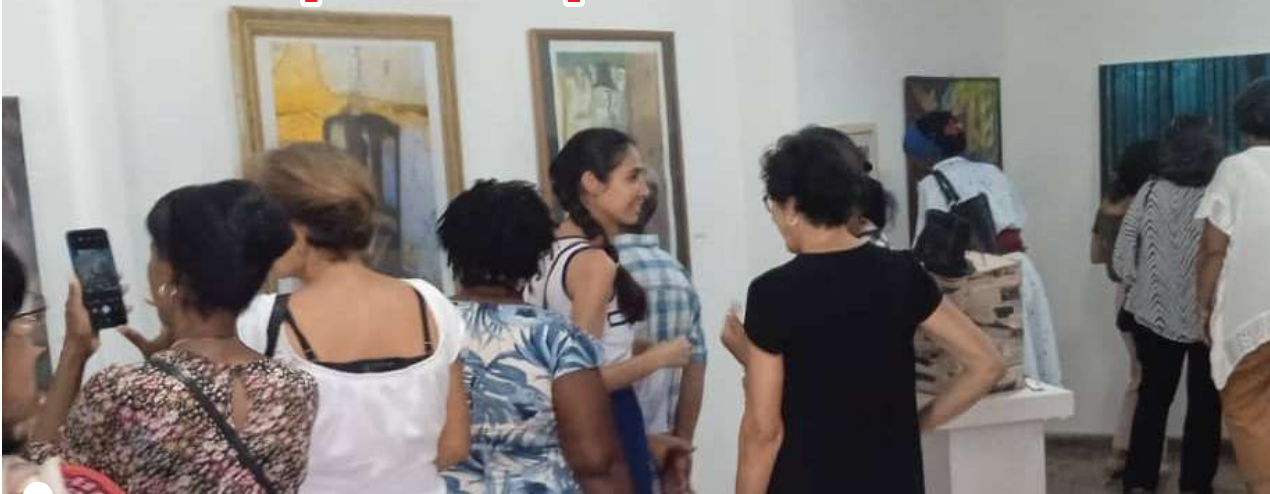
EL SALÓN Orígenes: un espacio para promover arte de primera calidad