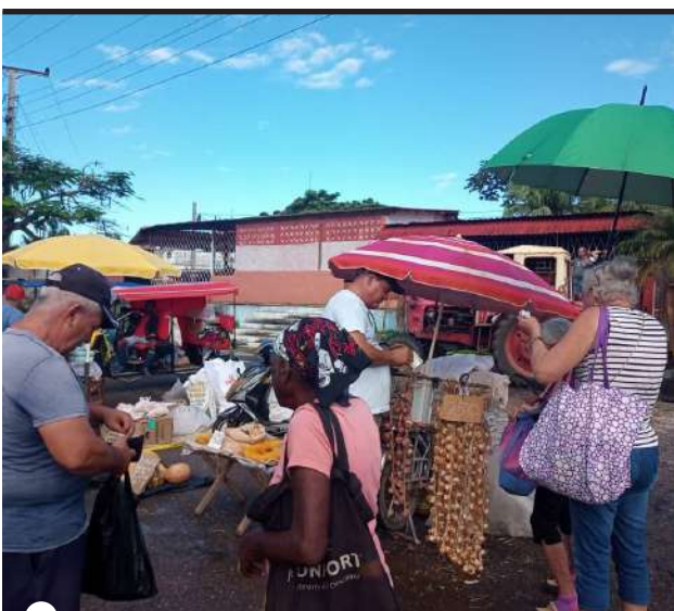
SAN CRISTÓBAL logra en su feria la presencia de diversos actores económicos que le dan dinamismo a ese espacio

pero tampoco esos precios "menores" pueden calificarse de baratos".