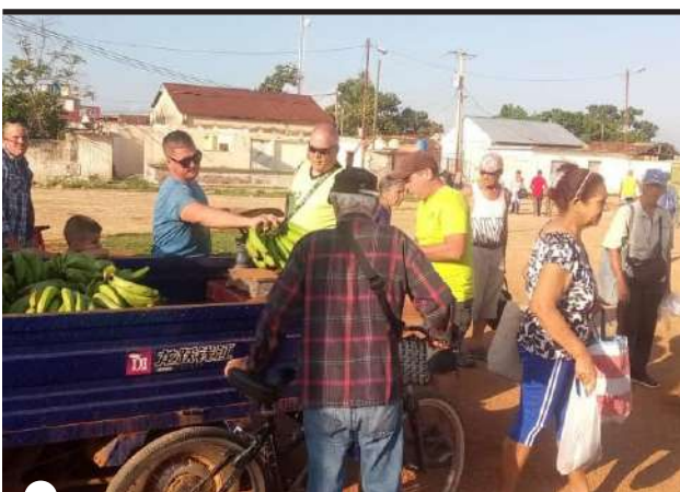
LA PLAZA alquizareña 4 de Abril exhibía el día de nuestro recorrido muy pocos productos