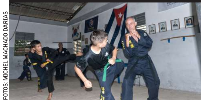
EL GIMNASIO SE CONVIERTE EN TALLER de disciplina y sueños, para decenas de niños y adolescentes