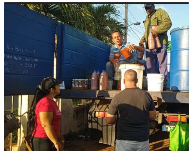
ESTAS ofertas en la feria de Artemisa vienen acompañadas de la posibilidad del pago digital, lo cual se agradece siempre

importado, frijoles, especias, vino seco, vinagre y algunos productos de aseo.