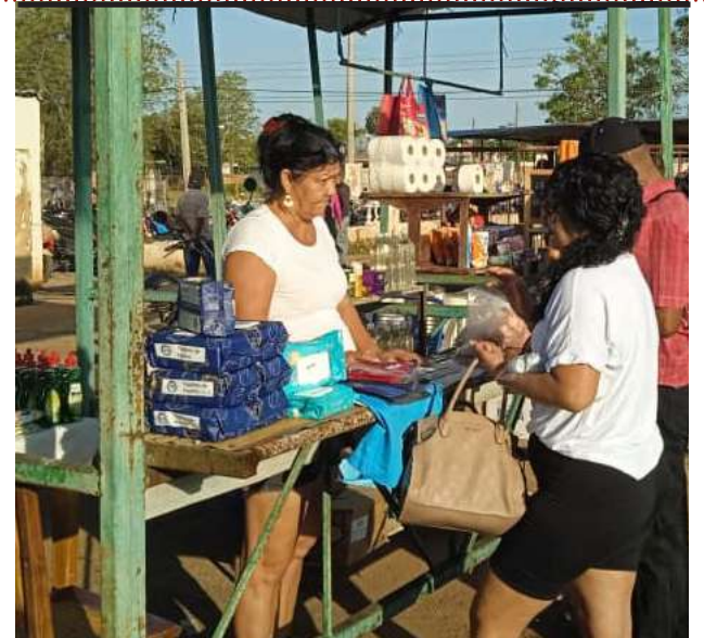
A LA FERIA de el municipio cabecera la distingue la variedad de productos

Desde Caimito también llegan trabajadores por cuenta propia en transporte arrendado con arroz