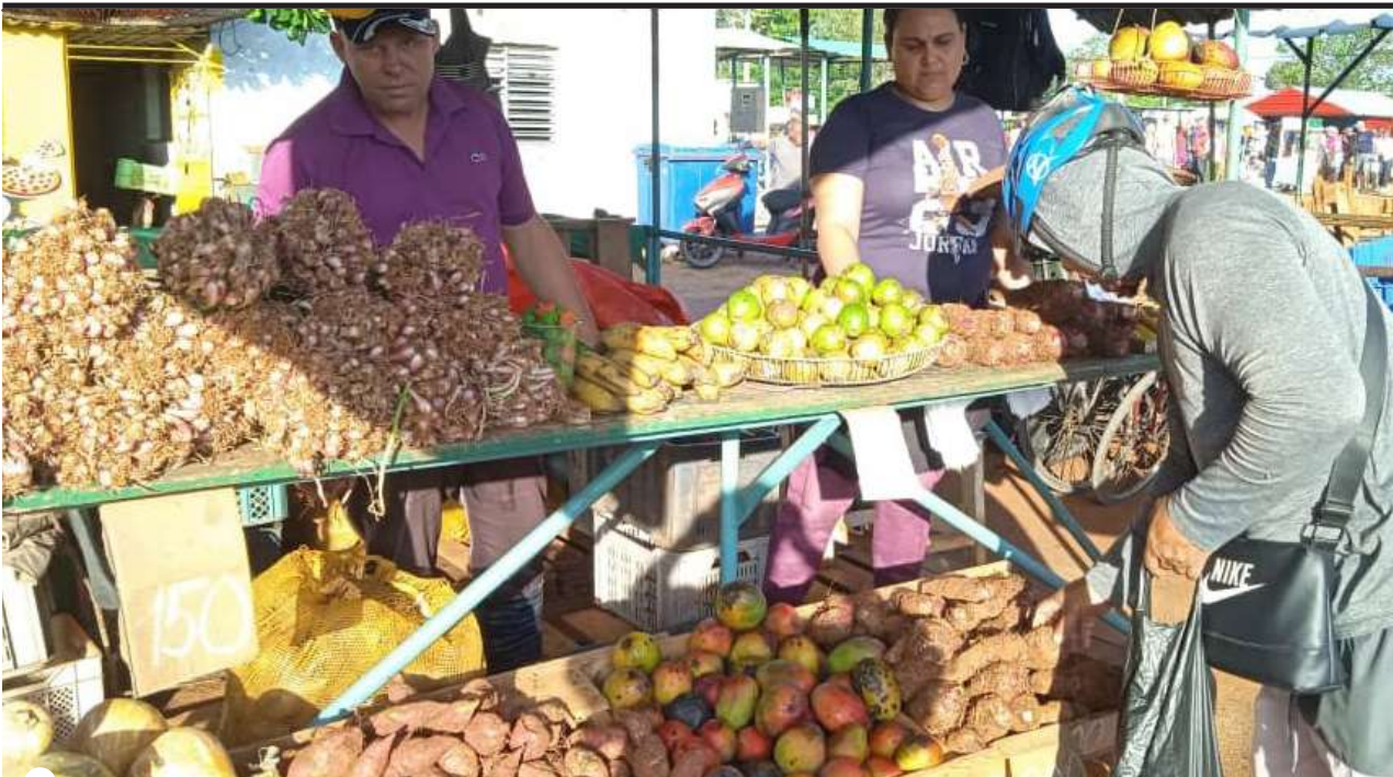
EN LA FERIA de Artemisa hay variedad de productos y presencia de formas productivas y de actores estatales y no estatales

otras prioridades comerciables para el pueblo, pero en los últimos tiempos,