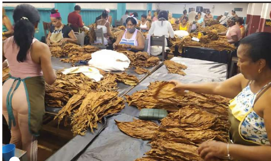
PARTE DEL ÉXITO en la Felipe Herrera radica en la unidad de su colectivo