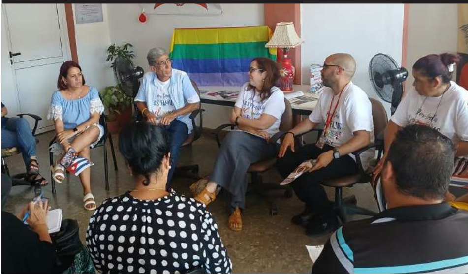
LOS PERIODISTAS artemiseños transmitieron a Mariela Castro un mensaje de apoyo y gratitud hacia su padre, el General de Ejército Raúl Castro Ruz