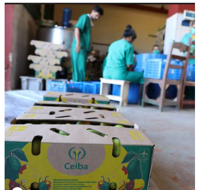
A TRAVÉS DE LA EMPRESA Cítricos Ceiba retomaron este año la venta a hoteles