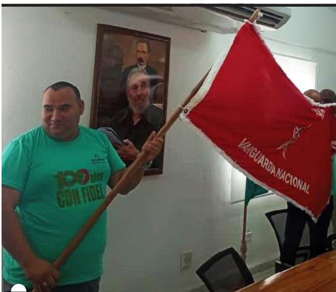
AZUMAT ratificó su condición de Colectivo Vanguardia Nacional