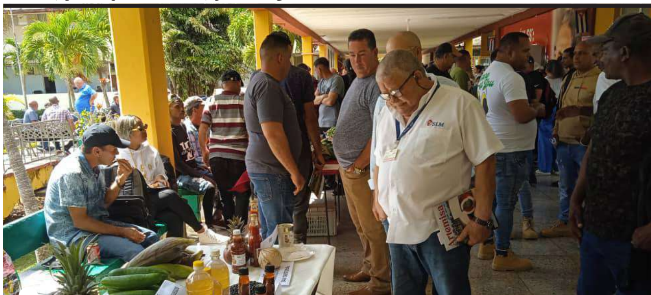
FUE UN ESPACIO para el intercambio entre actores económicos

LA STEVIA , planta originaria de Paraguay con propiedades superiores a la caña de azúcar, fue novedad