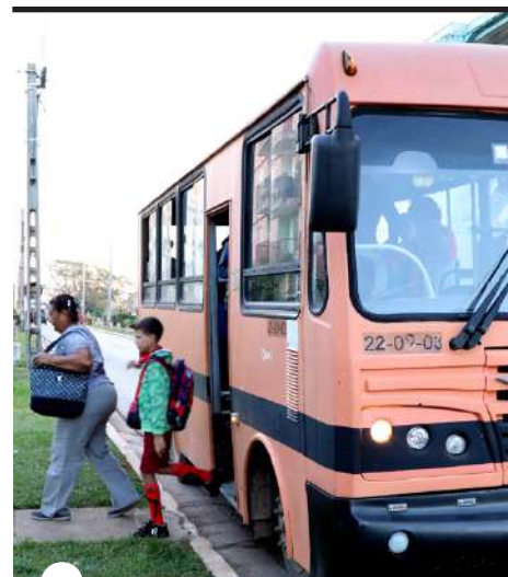
NO SE PUEDE viajar vacíos, indicación a no incumplir

“Además, trasladamos personal médico del habanero Instituto de Medicina Tropical Pedro Kourí y del Iván Portuondo, de San Antonio de los Baños, que viven en La Habana; incluso, reclusos con determinadas medidas cautelares que se ocupan de labores en centros hospitalarios de la provincia.