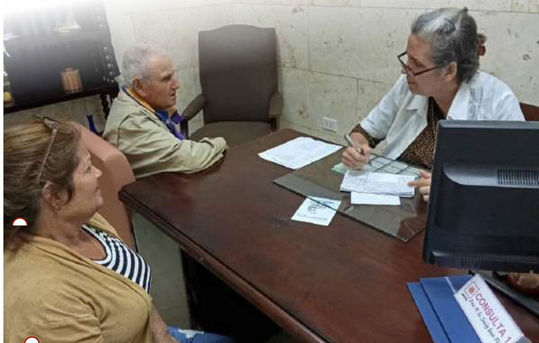
LA DRA. SAILY DEDICA TIEMPO , esfuerzo y muchas horas de investigación para ayudar a sus pacientes y familiares

TEXTO Y FOTOS CARLOS E. RODRÍGUEZ GONZÁLEZ carlosenriqueroedriguez850@gmail.com