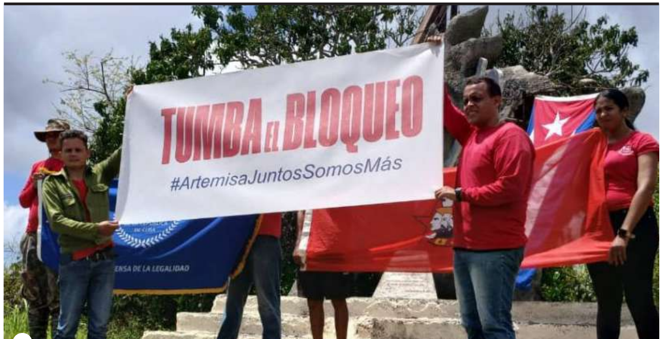
ANTES DE LA FOTO FINAL , el grupo alzó la voz contra una realidad que les duele: el bloqueo económico que durante más de seis décadas ha complicado la vida de los cubanos