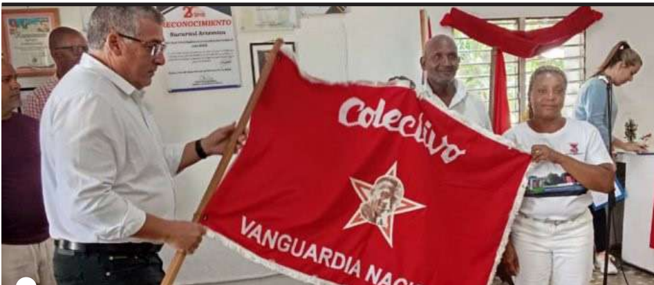
PALMARES tuvo entre sus mayores logros del 2025, la reconstrucción de varias de sus instalaciones

Cercanos al Primero de Mayo, la entrega de estas banderas es un incentivo para participar en la gran fiesta de los trabajadores, otra fecha para defender las conquistas de la Revolución y alzar la voz por la paz y la soberanía.