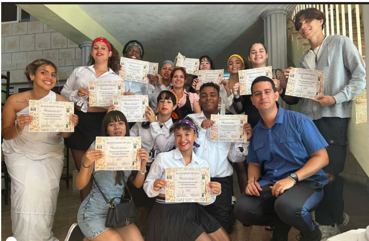
ESTUDIANTES ARTEMISEÑOS demostraron su talento

Hoy, una vez más, quedó demostrado que el diálogo entre generaciones y la apuesta por los nuevos valores no es solo una frase de cartel, sino una práctica viva. Y esta mañana, esa práctica tuvo el rostro renovado y vibrante de la juventud artemiseña.