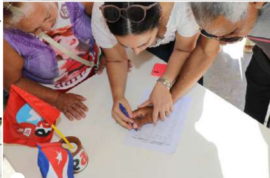
EN LA SEDE de el artemiseño se firmó por la paz