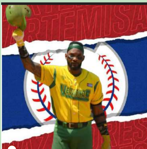
ALEXEI Ramírez está llamado a ser uno de los líderes del conjunto