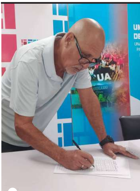
DESDE LA UNIVERSIDAD de Artemisa, Mi Firma por la Patria