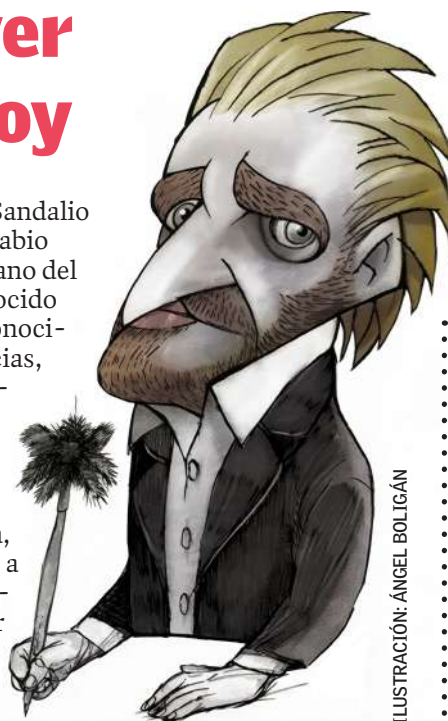
ILUSTRACIÓN: ÁNGEL BOLIGÁN

Por su labor y dedicación nuestro Héroe Nacional José Martí lo llamó "el pasmoso Noda" y "el sabio más laborioso de Cuba", y afirmó que "la tierra que da Nodas puede pasarse sin doctores" para defender la capacidad intelectual de los cubanos.