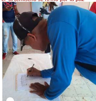
EN EL CUM de Guanajay también se sumaron estudiantes y trabajadores