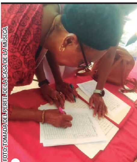
MUJERES EMPODERADAS dieron su firma desde la Casa de la Música de Artemisa