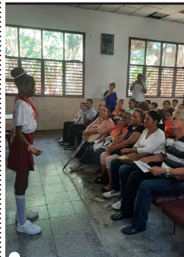
EN BAHÍA HONDA recordaron el aniversario 130 del combate de Cacarajícara

POR LUCIANO FELIPE danielsuarezrodriguez1968@gmail.com