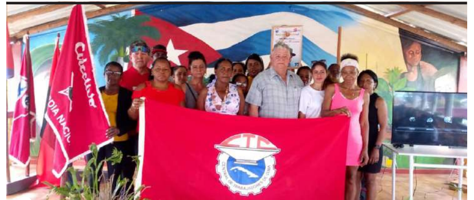
LA UBPC FELIPE HERRERA se destaca en indicadores económicos y en el trabajo con la comunidad