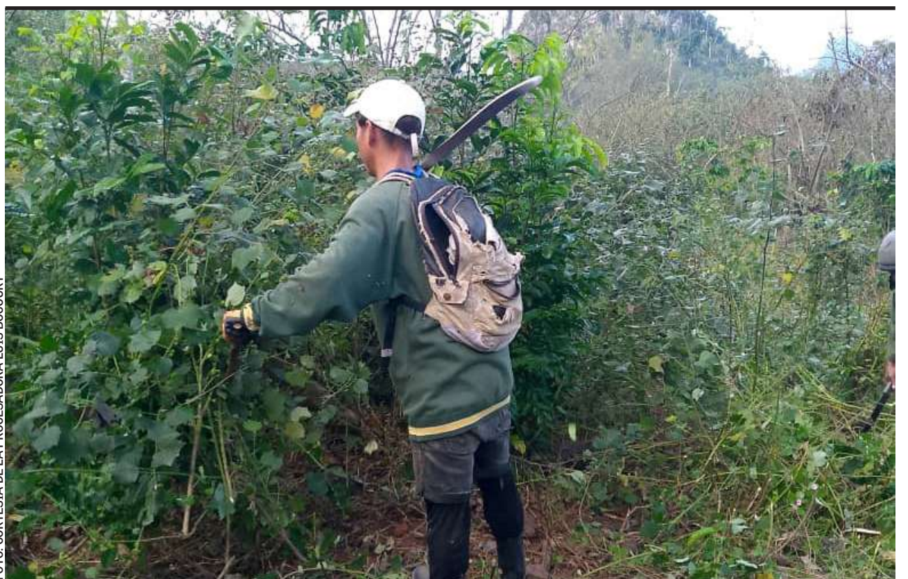
UNOS CAMPOS REQUIEREN rehabilitación y resiembra; otros, renovación

Los amantes del preciado néctar aseveran que una taza de café está llena de ideas. Y así es: proyectos, sueños y mucho tesón para colorear las lomas de granos rojos.