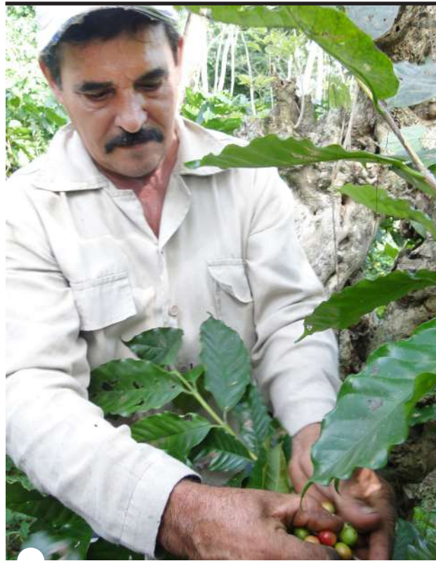
EL CAFÉ PRECISA mucho tesón, en el deshije, la limpia manual y la siembra

“Vamos a recuperar esas y mejorar las otras 20. Este contrato concibe dos años de gracia. Se prevé disponer de un grupo de recursos y maquinaria (motosierras, chapeadoras desbrozadoras, limas y