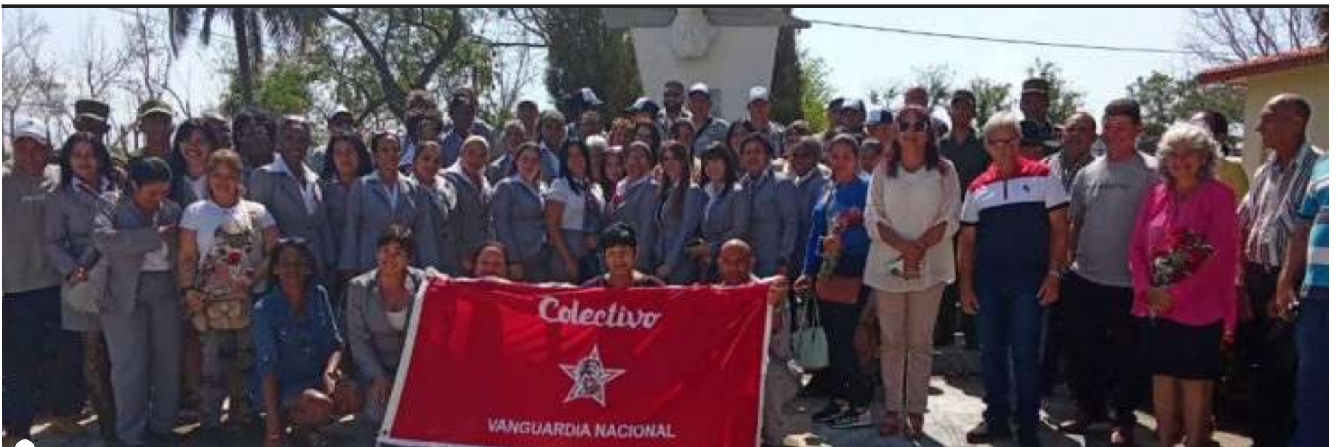
COPEXTEL Artemisa, Vanguardia Nacional