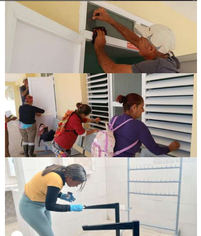
LOS TRABAJADORES no se han detenido a la hora de recuperar su mobiliario en cada departamento

nuestros clínicos, y equipada con camas eléctricas entregadas por el Ministerio”.