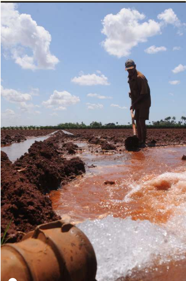
CADA PALMO DE TIERRA entregada debe revertirse en más comida en la mesa del cubano

Se trata de soluciones en busca de celeridad en un proceso apremiado por los resultados, porque llevar el alimento a la mesa no puede esperar, ni en Artemisa ni en Cuba toda.