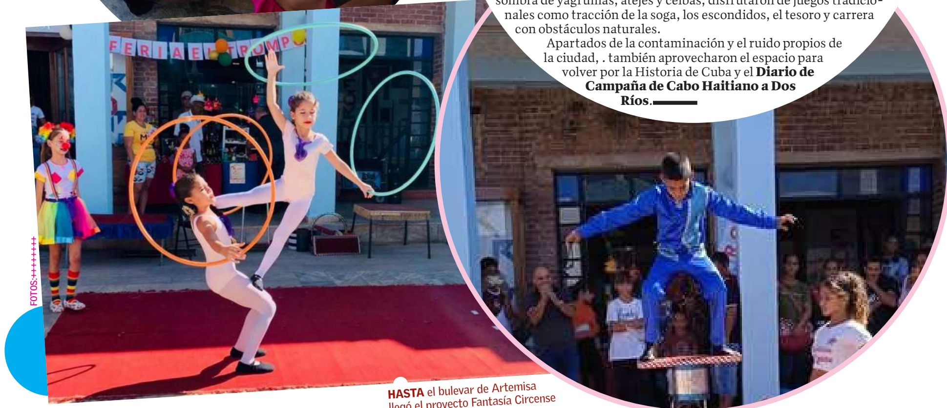
HASTA el bulevar de Artemisa llegó el proyecto Fantasía Circense

Apartados de la contaminación y el ruido propios de la ciudad, también aprovecharon el espacio para volver por la Historia de Cuba y el Diario de Campaña de Cabo Haitiano a Dos Ríos.