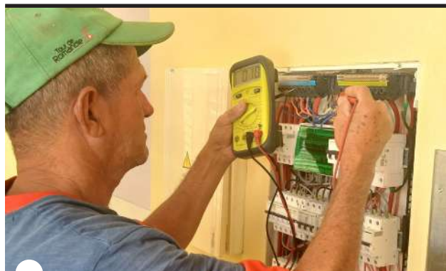
OBREROS DE LA BRIGADA No. 1 de Obras Varias comprobaban conexiones eléctricas de la institución

Cada espacio de la instalación se ha diseñado con especial cariño y dedicación. El día de nuestra visita encontramos a una artista visual empeñada en estampar una hermosa imagen, a la entrada de la sala de Ginecología. Todas las manos andan atareadas, para que más temprano que tarde, se abran las puertas de este anhelado lugar.