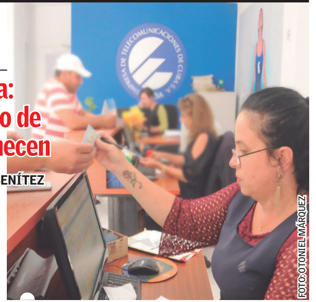
PROFESIONALISMO y preparación definen al colectivo de Etecsa en Artemisa

Desde ese entonces está en el sector. Cumplió su servicio social en la Universidad de Ciencias Informáti-