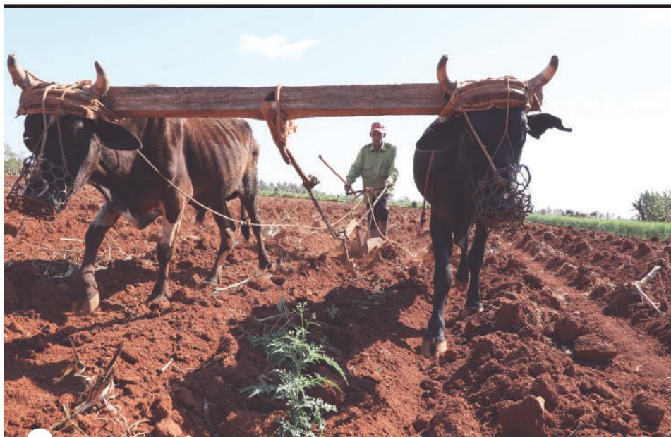
PEQUEÑAS PARCELAS de tierra son surcadas con tracción animal