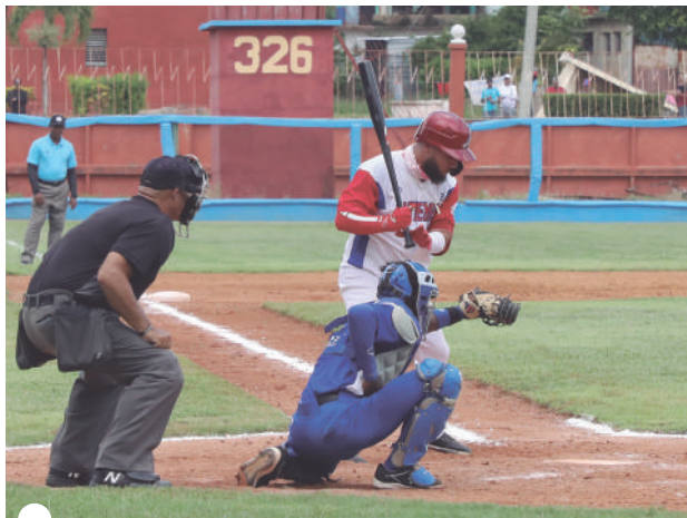
LOS RIVALES se convierten en presa de su hambre de épica, cuando tiene la oportunidad de decidir un juego