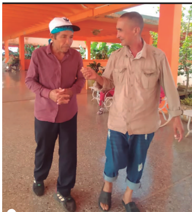
SIEMPRE andaban juntos, siendo más que compañeros de viaje los hermanos del bulevar

Su cuerpo, su ropa desaliñada y también su alma, olían a cualquier cosa. Alcohólico de raíz, quizás por ser el camino más cómodo ante la fatigosa convivencia, en Matanzas.