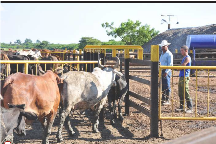
LA CARNE FIGURA entre los renglones de más baja producción

En materia de producción de alimentos para apoyar la canasta familiar, se trabaja todos los días en Artemisa, pero queda bastante por hacer en este empeño. Más allá de la limitación de combustible y electricidad, todavía hay que poner en práctica, entre otros, todos los resortes de la iniciativa estatal y popular. Nos falta mucho camino por andar.