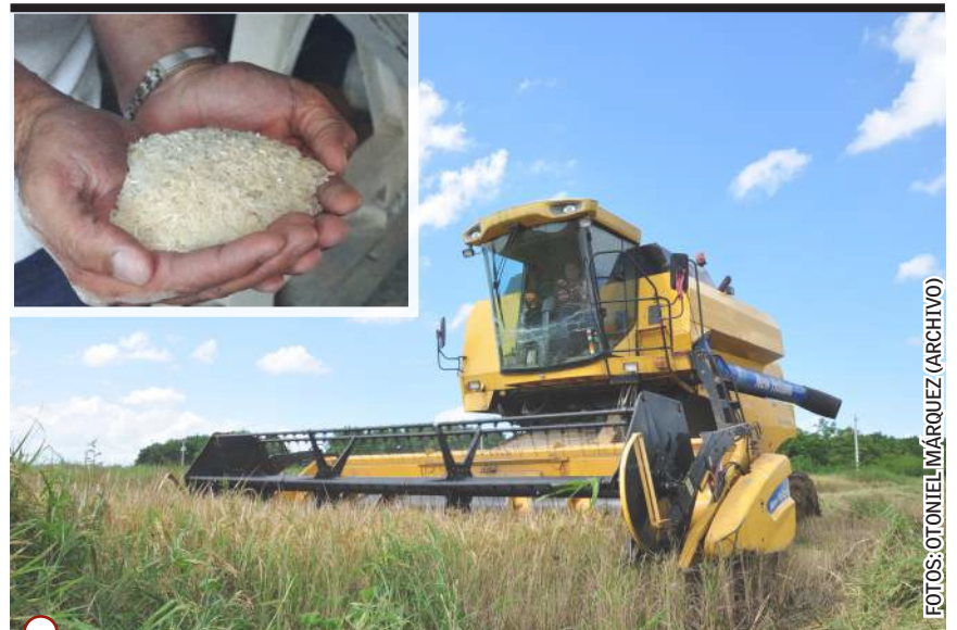
LA PROVINCIA NECESITA producir 17 583 toneladas (t) de arroz para autoabastecerse

Con respecto a la carne, precisó que en 2025, entregaron 20,1 t, cinco por encima de lo contratado. El mes pasado entregaron 680 kilogramos y al momento de nuestra visita estaban a la espera de combustible para llevar los animales al matadero.