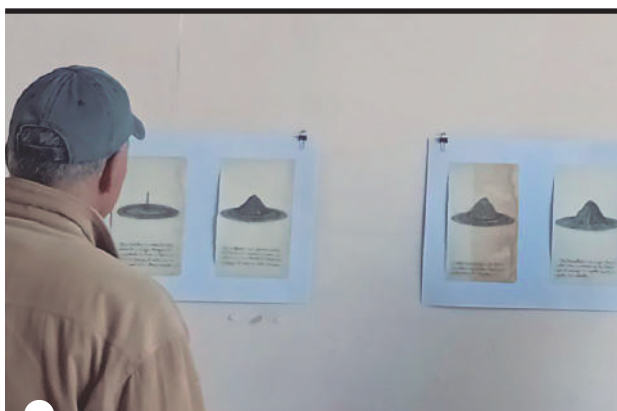
LA EXPO está a disposición del público en el Museo de San Cristóbal