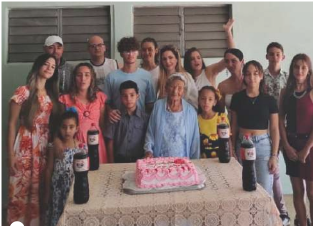
BASILIA celebró su centenario rodeada de familiares

POR MARÍA CARIDAD GUINDO GUTIÉRREZ mguindogutierrez@gmail.com