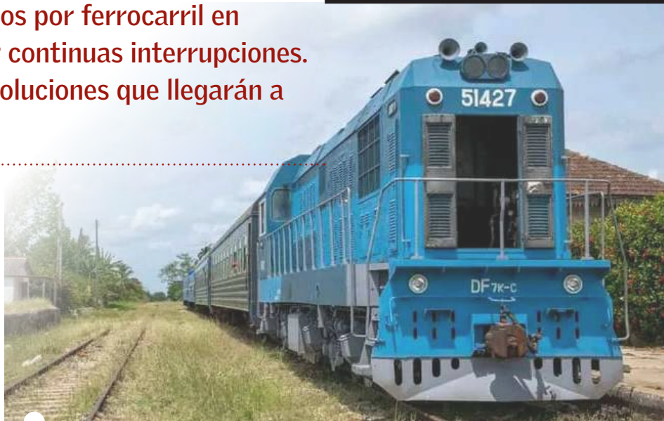
EL TREN es un medio de transporte de mucha demanda

El ómnibus de la Empresa Provincial de Transporte que rinde el itinerario sobre rieles (conocida como la Diana de Filian),