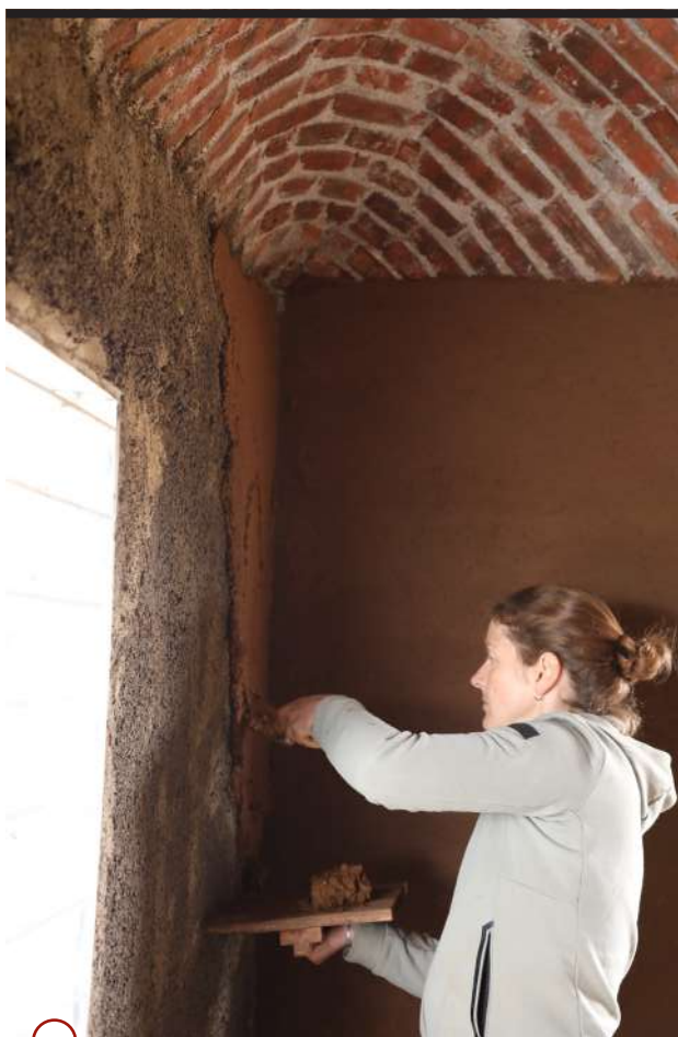
LAS BÓVEDAS DE LADRILLOS lucen hermosas y demandan menos materiales que las cubiertas convencionales

La especialista comentó que, luego de los terremotos del 2001, en su patria investigaron cómo fortalecer estas estructuras, hasta lograr un reglamento técnico para construir una vivienda de un nivel, con adobe reforzado, que exige contrafuertes, varas horizontales y verticales, los bloques de 150 libras a compresión,