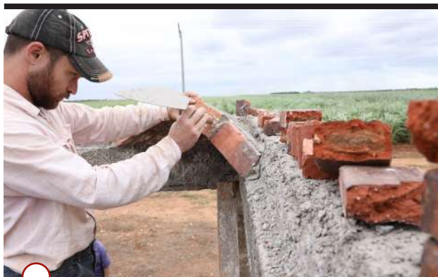
LA CONSTRUCCIÓN CON ADOBE demanda esfuerzo físico y participación colectiva

Y esta comunidad en ciernes tendrá otra singularidad: la primera casa de adobe en Artemisa,