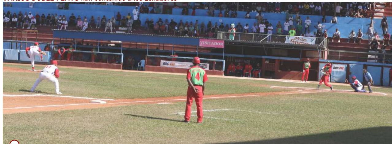
CUANDO EL PICHEO ANDA BIEN, los maderos rivales no producen

su gente, que los ha respaldado con las gradas llenas. Los Cazadores han flechado a su público.