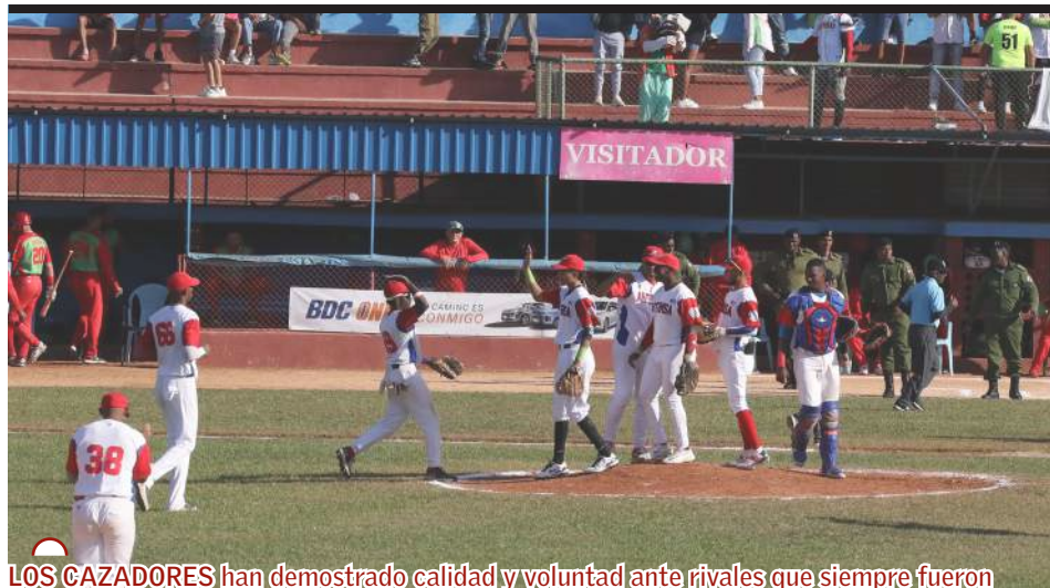
LOS CAZADORES han demostrado calidad y voluntad ante rivales que siempre fueron considerados favoritos