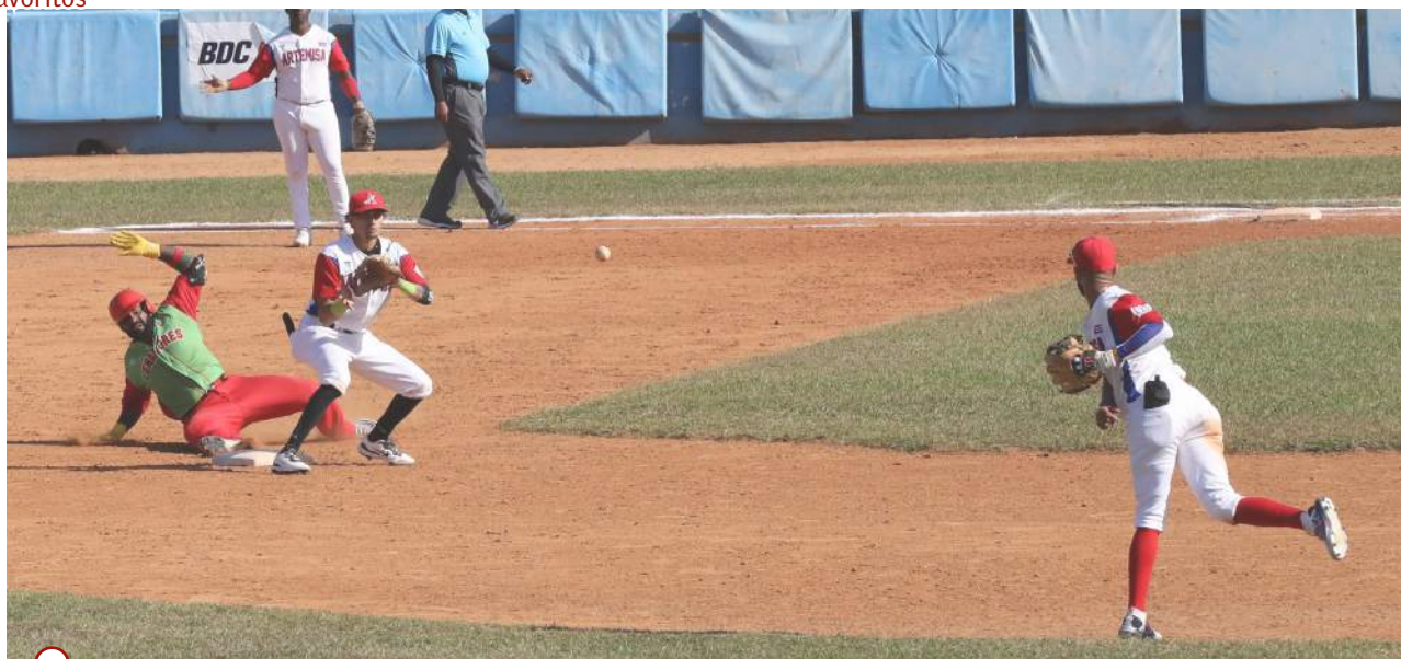
VARIOS DOBLE PLAYS han contenido a los Leñadores