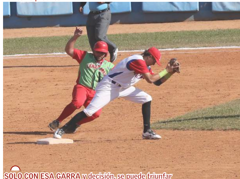
SOLO CON ESA GARRA y decisión, se puede triunfar