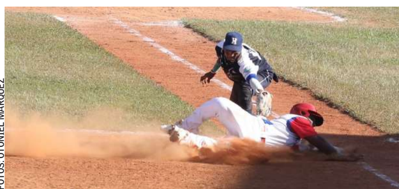
JUGANDO DE ESTA MANERA, se han ganado el corazón de los artemiseños