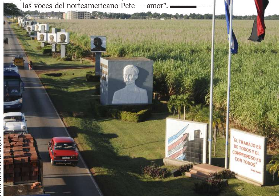
MARTÍ da la bienvenida a la ciudad que más hijos aportó al Moncada, justo en el año de su centenario

También en las de muchos que un día bebieron hasta saciarse de la prosa y el verso de un hombre universal, que lograba escribir, con igual sinceridad, “el enemigo solo ha de oír la voz de ataque”, o “amor cuerdo no es amor”.