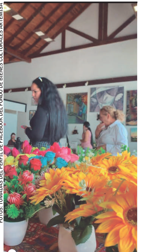
EL PÚBLICO asistente pudo acceder a variados productos de nuestros artesanos