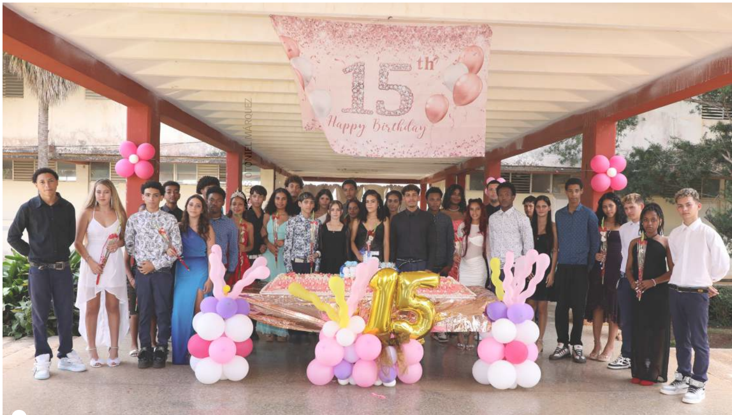
ENTRE LAS ACTIVIDADES extradocentes mejor acogidas este año, estuvo la celebración de los 15 colectivos

favorecido muchos procesos y poco a poco se han ido engranando, para formar una familia e incidir en los jóvenes a los que deben conducir por los caminos del magisterio.