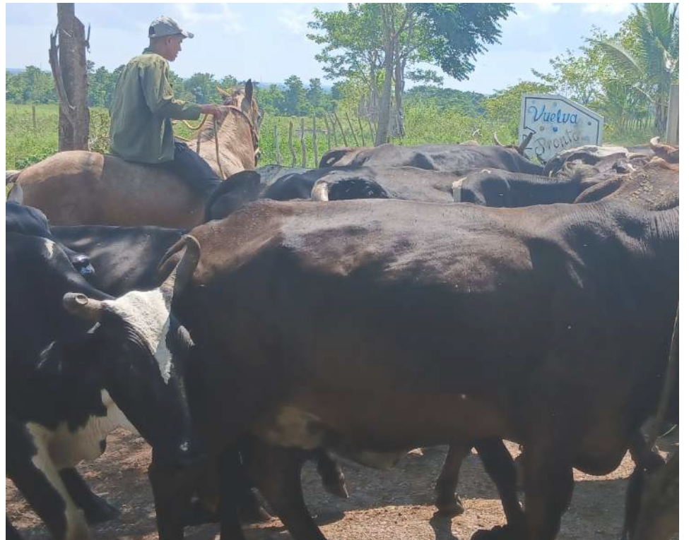
YOANDRY considera otro acierto la implementación del sistema Voisin para rotar cuarterones

Pero la sensibilidad de Yoandry trasciende lo agrícola para expresarse hacia sus semejantes. En Candelaria lo conocen por la tradición de donar sangre, junto al resto de sus empleados.