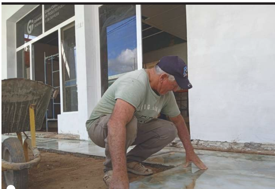
VARIAS INSTALACIONES del centro de la ciudad han cambiado su imagen