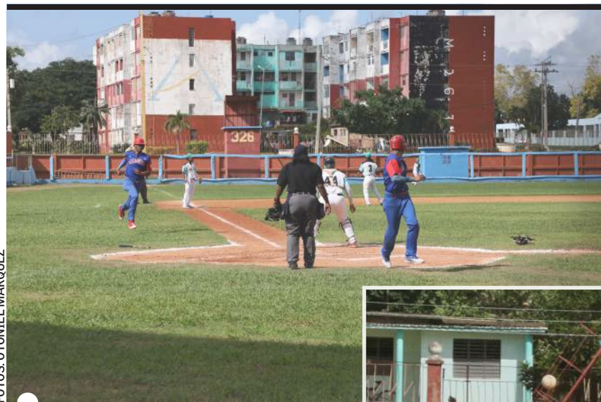
CAZADORES HILVANARON cinco triunfos y llegaron a 40

Fue el recordista de Cuba en salvamentos quien impidió que la pizarra se moviera más. Por cierto, con