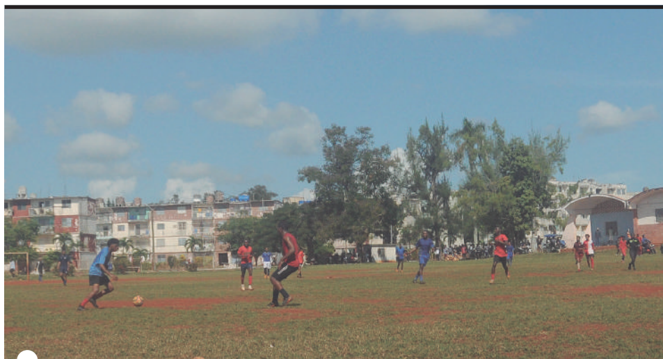
TANTO Güira como Caimito, Bauta y Candelaria realizaron un buen torneo. Se espera más de San Cristóbal y Artemisa