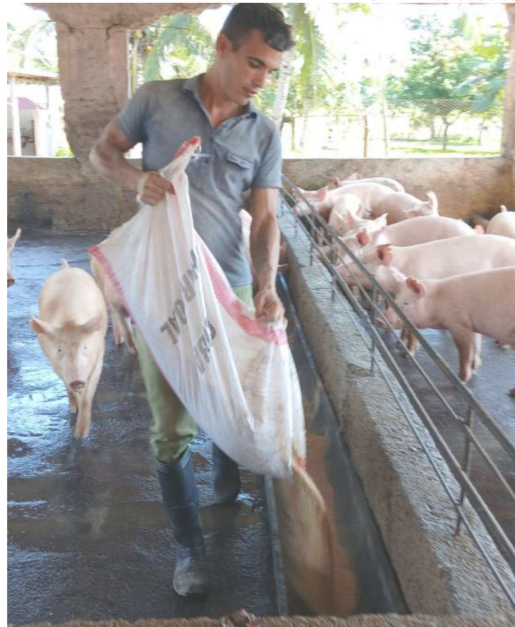
EL AGRICULTOR dispone también de una cría de entre 2 000 y 3 000 cerdos

También, durante la pandemia de Covid-19, regaló la totalidad de los cultivos a los centros de aislamiento. “Hasta me ingresaron en la finca y en ese tiempo no paró la producción, ni dejaron de acopiarse los 200 litros de leche que tanta falta hacían”.