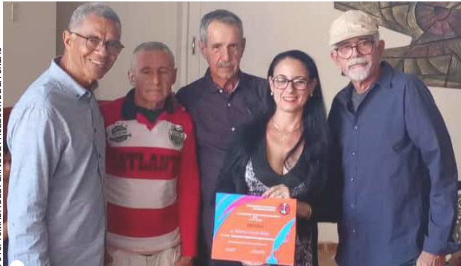
MYREISI RESULTÓ LA GANADORA del Premio Rubén Martínez Villena