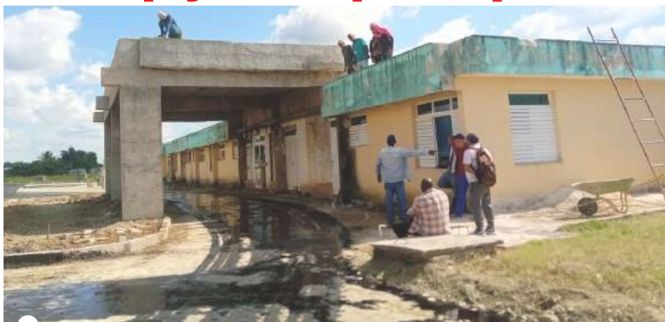
EL SERVICIO de hospitalización del policlínico de Bahía Honda es una obra muy necesaria