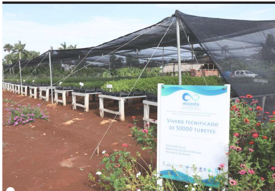
VIVERO EN BOCA de Cajío apoya reforestación de la costa sur