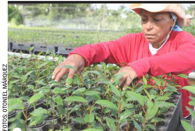
EL PROYECTO ESTIMULA la incorporación de la mujer rural al trabajo

a los empleados, muchos de ellos con limitantes, que antes debían caminar hasta 6 kilómetros para llegar a sus puestos, comentó el directivo.