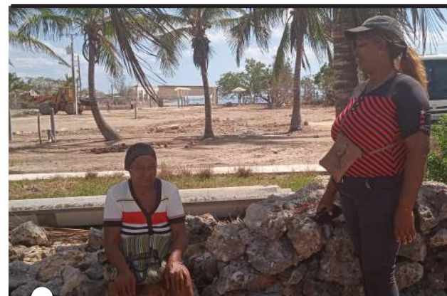
YAMILÉ asume el acompañamiento a los damnificados

Continúan las investigaciones con los organismos pertinentes, tema al que daremos seguimiento en las diferentes plataformas del periódico.