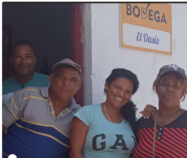
EN LA FAMILIA y los amigos encuentra un sostén

Tampoco hay muchas opciones para quien acomodó una vida basada en la prevención y la reacción inminente, cuando se elige el riego de vivir en la costa.