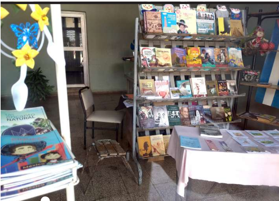
AUNQUE estaba cerrada por inventario, hay variedad de títulos y otras ofertas

El libro es un gran invento de la humanidad, y lo seguirá siendo en su formato de siempre o en formato digital. Por eso, soñando un poco, pienso, como Borges, que si alguna forma tiene el Paraíso, es la de una biblioteca repleta de libros, que hoy no solo se adquieren en las librerías clásicas. Si tuviera otra forma, no me parecería tan bello. ■■■■■