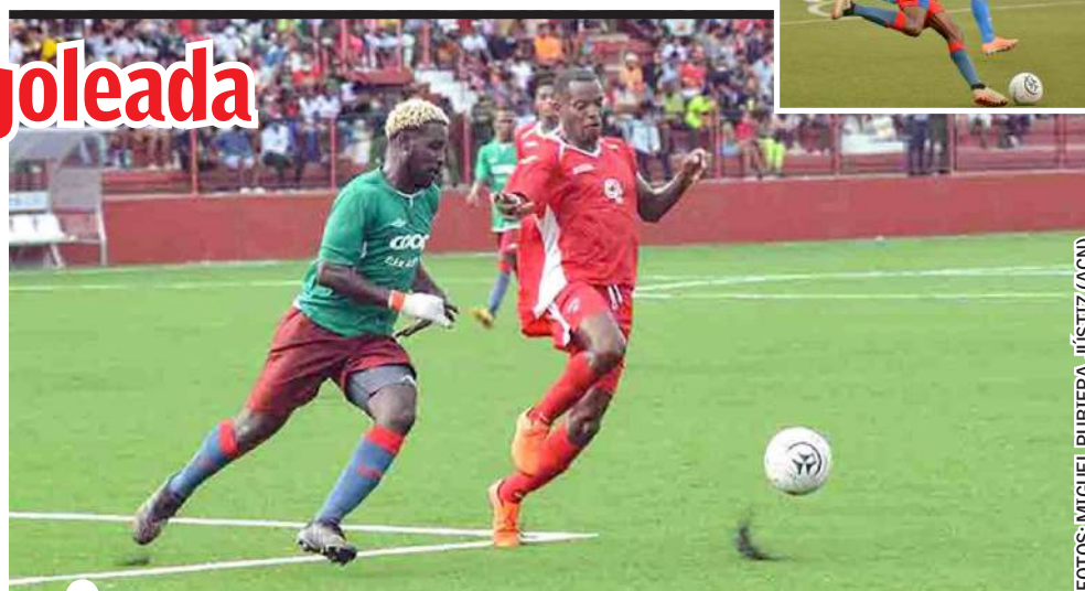
VARIOS factores evitaron que Artemisa lograra su sueño

Nada está perdido. El Torneo Apertura solo fue el calentamiento para el Clausura, cuando se definirá el título “de verdad”: el de campeón de Cuba. ¡Ojalá y cada uno de esos siete goles en contra sirvan de motivación para levantar la próxima Copa!