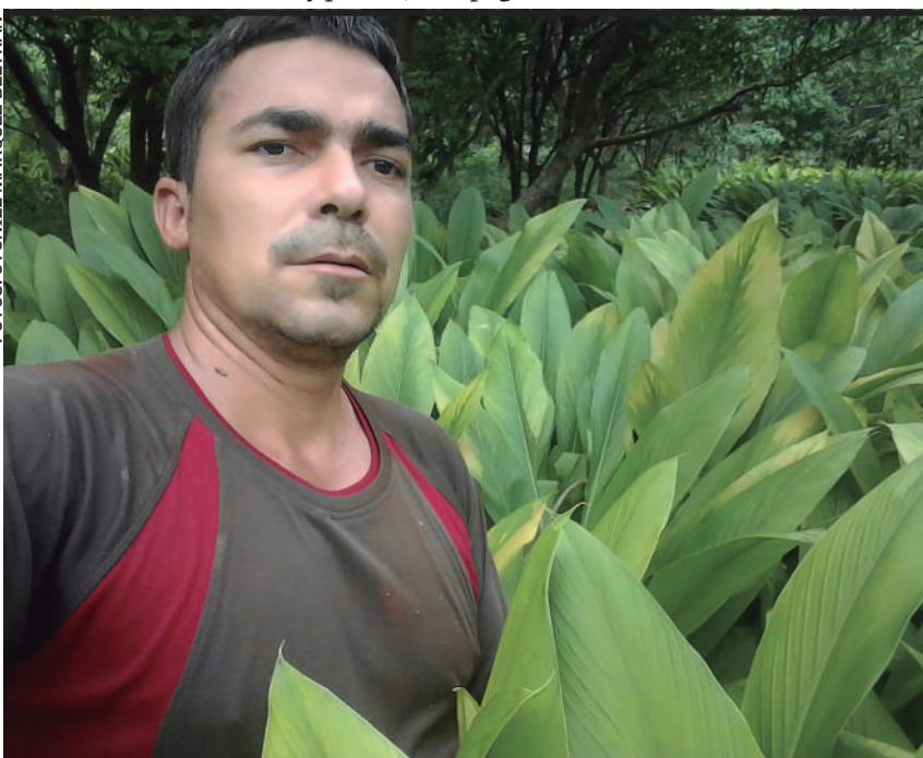
HIDEL se sabe enamorado de la agroecología y aprovecha sus buenas prácticas

LA SIERRA MAESTRA DE ESTE LLANO «LA ANAP, 61 AÑOS DESPUÉS DE SU PRIMER DÍA, VALIDA EN EL CAMPESINADO CUBANO SUEÑOS Y PERSEVERANCIAS, CON CIENCIA, SACRIFICIOS Y RESULTADOS»