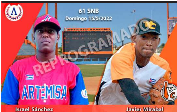
AL CIERRE de esta edición recuperaban dos ante Villa Clara, y otro hoy martes

El fin de semana partieron hacia Villa Clara con tal de celebrar los tres desafíos aplazados por el brote de COVID-19 que afectó al equipo; al cierre de este lunes jugaban doble programa, y sencillo hoy martes. Jueves y viernes enfrentarán a Industriales en el Latino, choques previamente suspendidos por la tragedia del hotel Saratoga.