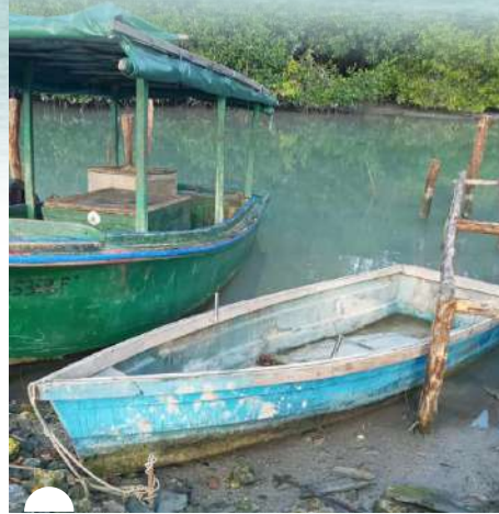
RESIDENTES temen perder por completo su río, ante la imposibilidad del dragado

Enseñanzas, impulsos y motivaciones. En varios escenarios, el Primer