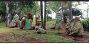
MONUMENTO AL ÁRBOL, LA UTOPIA DE FELO «PANORÁMICA DEL ÁREA DONDE QUEDARÁ INAUGURADO, EL 19 DE MAYO, EL MONUMENTO AL ÁRBOL»