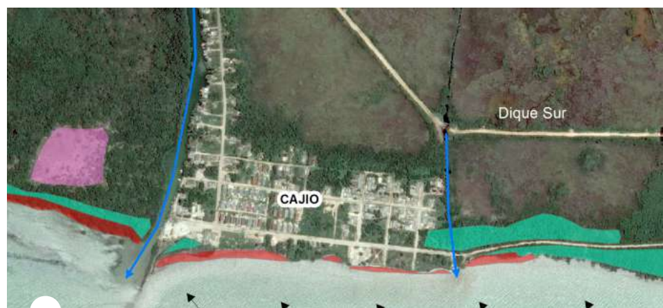
MAPA de Cajío

En ocho años de ejecución, instituirá pautas sobre las condiciones del manglar, la salinidad y el paso de eventos meteorológicos.