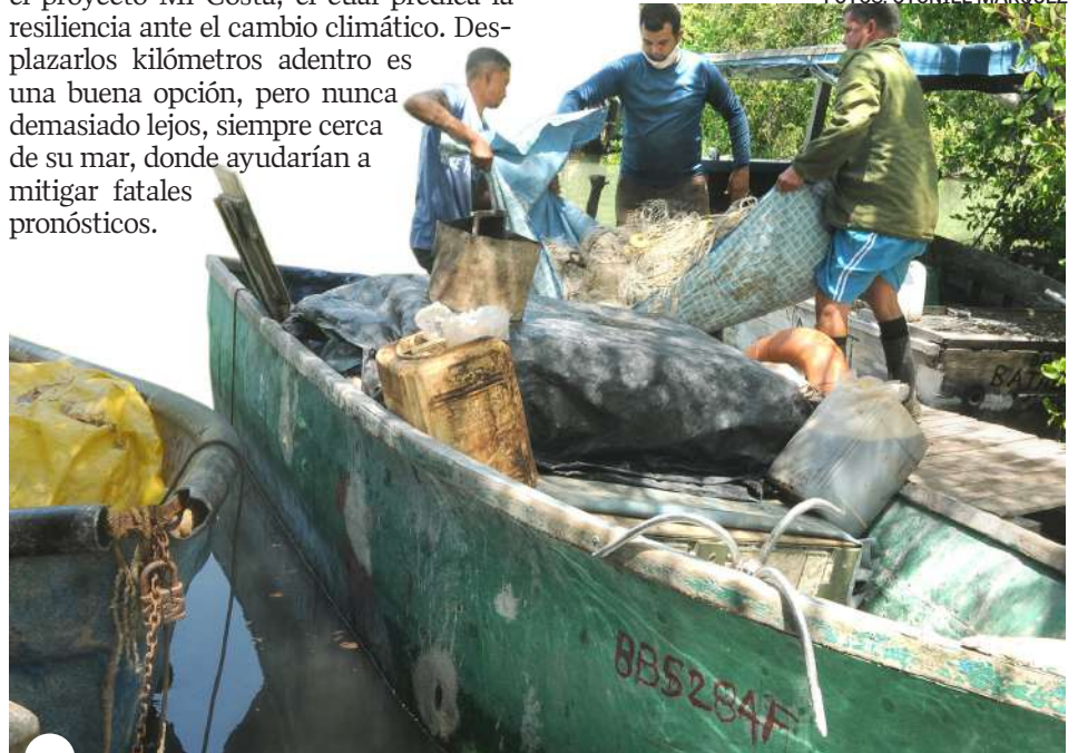
CADA SALIDA al mar constituye retos y realizaciones para los pescadores