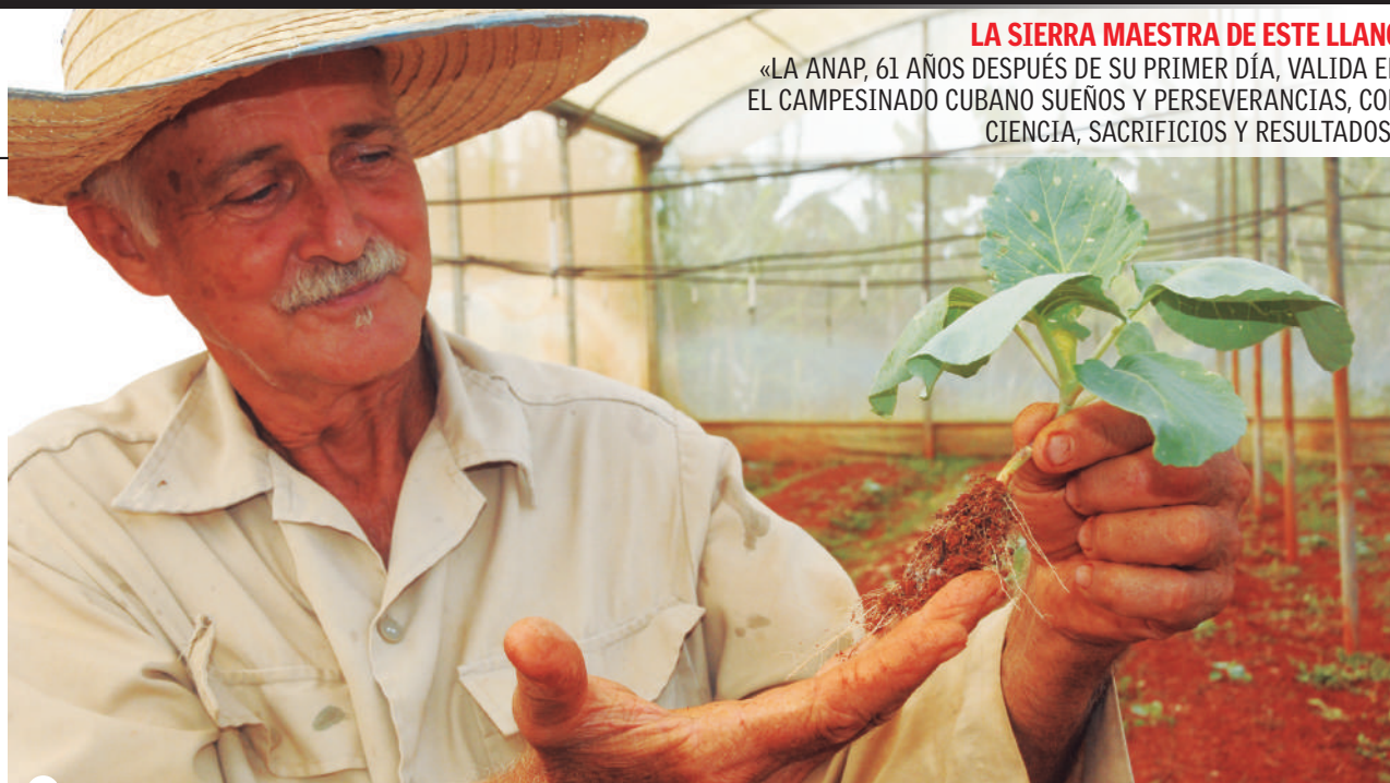
EN LA ERNESTINA producen tres variedades de berenjena, dos de ají cachucha y varias de tomate

La aceptación de sus posturas está en los insumos: el humus de lombriz, obtenido en la finca; el BIOFER, del Instituto de Suelos, que propicia a la planta la absorción de nitrógeno y los bioestimulantes EcoMic y QuitoMax del INCA.