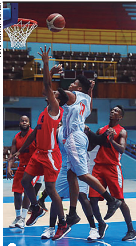
EL ACCIONAR de los Toros mantiene sus altibajos