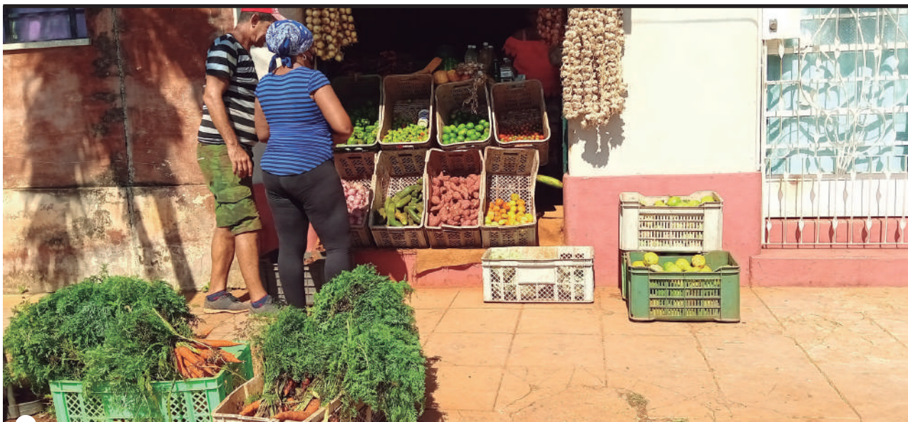
PUNTO de venta de la calle 70, entre 39 y 41 (TCP) con más de 27 productos, a precios más elevados que los kioscos estatales y de mayor aceptación por su calidad

En manos de los gobiernos y las intendencias está la solución a este dilema. Las producciones crecen, pese a los inconvenientes. No sería descabellado organizar, controlar, tomar decisiones que beneficien más a quien produce y afecten menos quien consume.