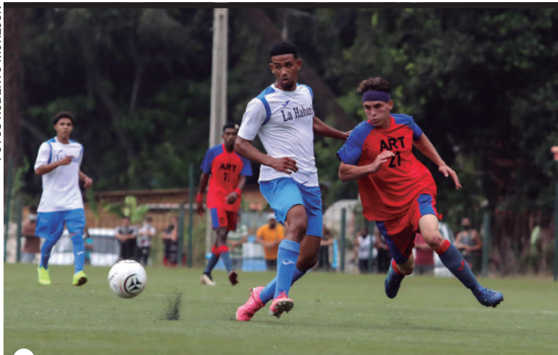
ARTEMISA volvió a superar a La Habana

En el B, Santiago (34) aseguró su presencia en la final, al golear 4-0 a Ciego de Ávila (11), mismo marcador con que Las Tunas (26) superó a Granma (16). Camagüey (24) y Guantánamo (20) empataron 0-0 y sacaron boletos para el Clausura. Sancti Spiritus (2) al fin pudo romper su racha de 12 partidos sin marcar, e igualó 1-1 con Holguín (9).