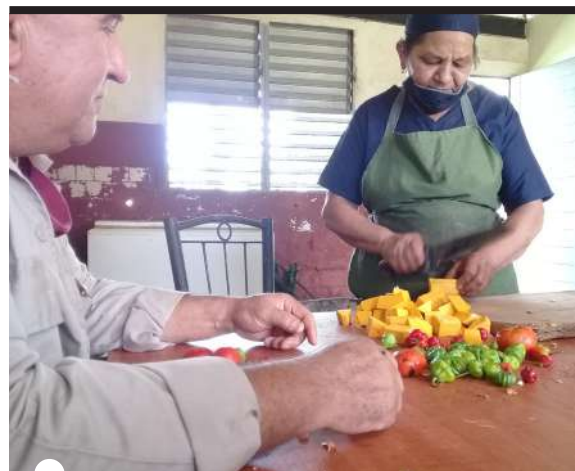
LA CCS FLORES Betancourt aportó los ingredientes para un sabroso ajiao

El añejo problema de no contar con un sistema de agua potable les hace depender siempre de este servicio a través de pipas, lo cual debe tener alguna solución que pueda incluirse en el plan de la economía,