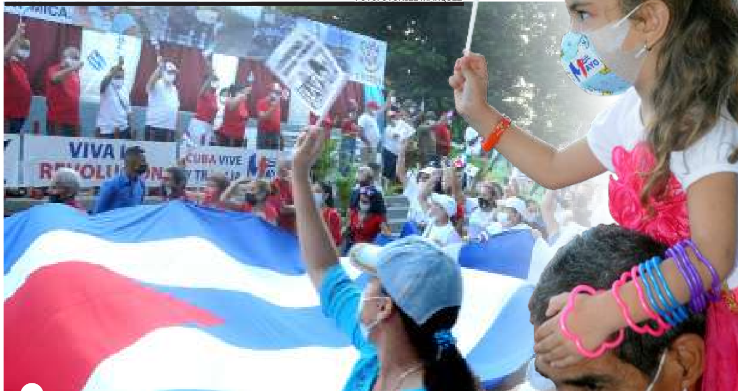
DESFILE de banderas, ideales y sueños