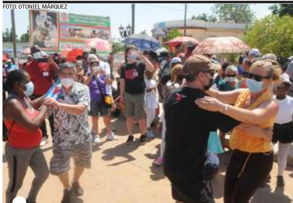
AUNQUE muchos no dominan el español, disfrutaron de la cultura junto a vecinos del barrio El Chalet

comunidad, en la circunscripción 36 del consejo popular Toledo, los vecinos recibieron a los brigadistas con la alegría que conservan los cubanos, convertidas después en instantáneas.