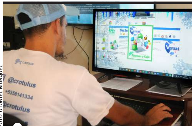
HASTA ahora C ROTULUS cuentan con unos 25 clientes en Artemisa

C-ROTULUS fue la solicitud número 27 inscrita en la plataforma creada por el Ministerio de Economía y Planificación para los nuevos actores económicos, en noviembre de 2021 se sumó a otras siete aprobadas en